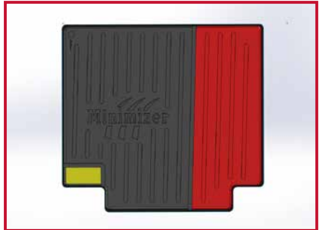
Figura 4 - Diagrama de recorte

7. A continuación, instale el tapete para el lado del pasajero del vehículo.