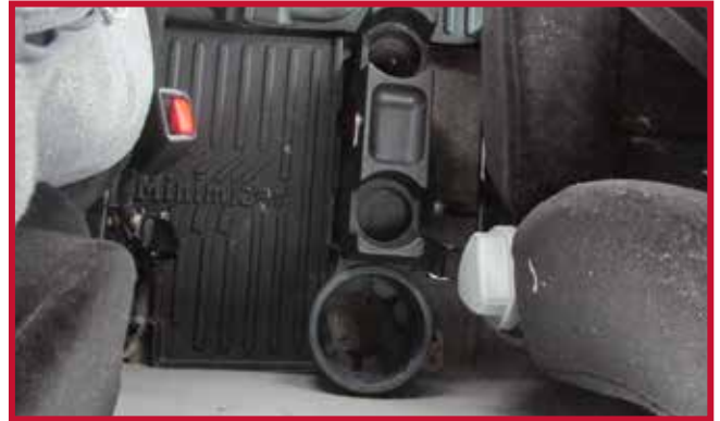
Figura 3 - Soporte para termos de fábrica

6. En los casos en los que se monta un extintor detrás del asiento del conductor, la esquina trasera izquierda del tapete central sombreada en amarillo puede recortarse para dejar espacio libre.