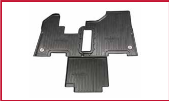
Figura 2 - Contenido del KIT #10002712

Los camiones equipados con un soporte de termo de fábrica requieren el recorte manual del tapete central. Se ha moldeado una línea de corte elevada en el tapete para utilizarla como guía y para la contención de líquidos.