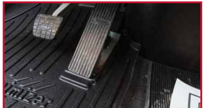
Figura 5 - 10002853 Instalación del tapete del conductor

• En algunos casos, se montará un armario eléctrico de acero o plástico en la zona del suelo en la esquina delantera izquierda de la cabina, como se muestra en la figura 6. Si el armario eléctrico está presente, la parte delantera izquierda del tapete del conductor tendrá que ser recortado a mano a lo largo de la costilla elevada. El área a recortar está sombreada en rojo en la Figura 7.