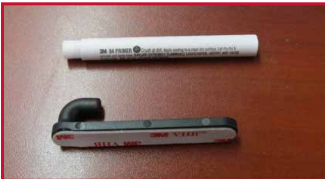
Figura 8 - Gancho y Primer 94

7. Introduzca el gancho a través del orificio de la esquina trasera derecha del tapete del lado del conductor. El gancho debe quedar al ras de la parte inferior de la alfombra del piso.