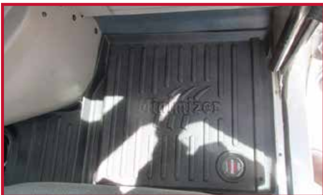
Figure 10 – Tapis côté passager en place

16. Placer le tapis protecteur côté passager dans le camion. S'assurer que le tapis côté passager est poussé à fond vers l'avant afin que la lèvre extérieure soit entièrement en contact avec le panneau de finition de la section de jonction et la cloison pare-feu, comme montré à la Figure 10.