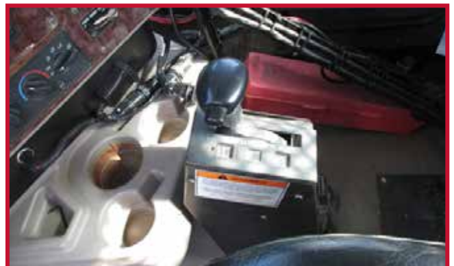
Figure 8 – Tour de commande montée au plancher

Remarque : Certains camions moins récents avec une boîte de vitesses automatique sont équipés d'une tour de commande qui est fixée au plancher, comme montré à la Figure 8. Le tapis central doit être découpé à la main pour être compatible avec les tours de commande montées au plancher.