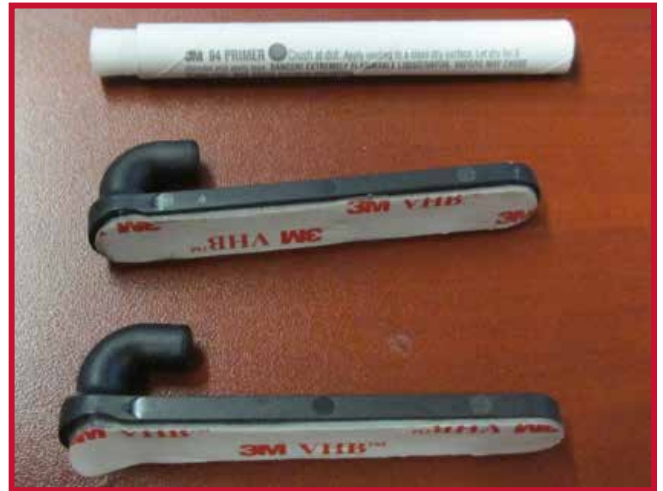
Figure 6 – Caisson électrique et tapis protecteur côté conducteur