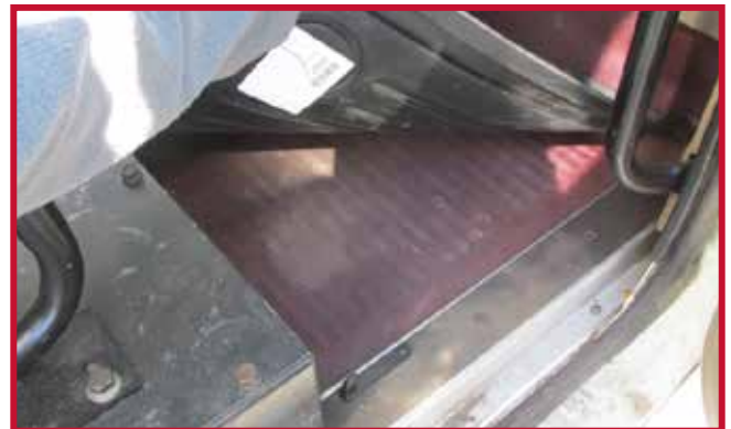
Figure 11 – Crochet de tapis côté passager en place

18. Confirmer que le crochet de retenue est entièrement engagé dans le tapis côté conducteur et que le crochet est collé au plancher. Si le crochet de retenue du tapis côté conducteur ne fonctionne pas correctement ou si le tapis ne peut pas être installé de manière sûre, ne pas utiliser de tapis protecteur Minimizer du côté conducteur du véhicule.