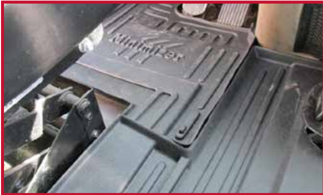
Figure 9 – Crochet du tapis côté conducteur en place

Marquer l'emplacement approximatif où le crochet doit être fixé au plancher. Une fois l'emplacement localisé, retirer le tapis côté conducteur du camion.