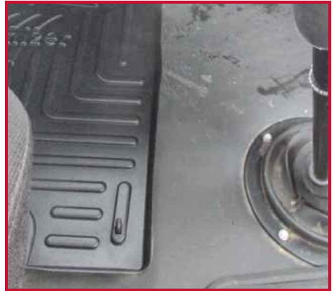
Figure 9 – Installation du crochet du tapis côté conducteur

9. Débarrasser le tube d'Apprêt 94 et lire les consignes de sécurité imprimées sur le tube.