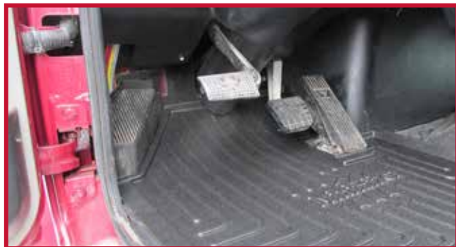
Figure 6 – Caisson électrique et tapis protecteur côté conducteur

• Dans certains cas, un boîtier électrique en acier ou en plastique sera monté au plancher dans le coin avant gauche de la cabine, comme montré à la Figure 6. Si le boîtier électrique est présent, la partie avant gauche du tapis côté conducteur devra être découpée à la main le long de la nervure surélevée. La zone à découper ombrée rouge est montrée à la Figure 7.