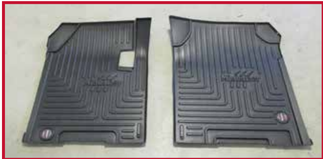
Figure 1 – Contenu de la trousse 10002807