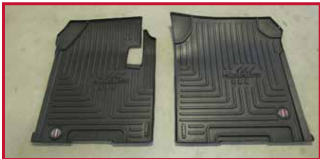
Figure 3 – Contenu de la trousse 10002853

* Le tapis côté passager 10002853 nécessite un découpage à la main. Voir l'étape 15 de l'installation pour les détails.