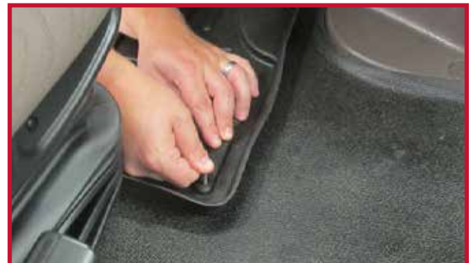
Figure 10 – Appliquer une pression sur le crochet

15. Placer le tapis côté passager dans le camion. S'assurer que le tapis côté passager est poussé à fond vers l'avant afin que la lèvre extérieure soit entièrement en contact avec le panneau de finition de la section de jonction et la cloison pare-feu.