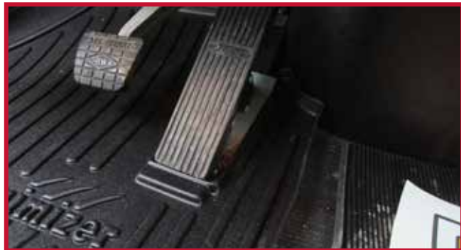
Figure 5 – Installation du tapis côté conducteur 10002853

• Dans certains cas, un boîtier électrique en acier ou en plastique sera monté au plancher dans le coin avant gauche de la cabine, comme montré à la Figure 6. Si le boîtier électrique est présent, la partie avant gauche du tapis côté conducteur devra être découpée à la main le long de la nervure surélevée. La zone à découper ombrée rouge est montrée à la Figure 7.