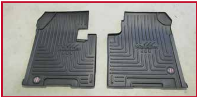
Figure 2 – Contenu de la trousse 10002841