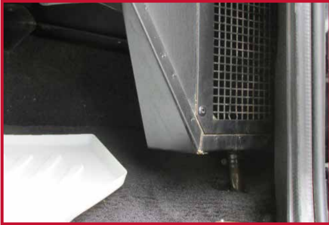
Figure 11 – Unité de CVC haute capacité

• Pour les camions Western Star 4900SA, 4900FA, 4900SB et 4900SF des années-modèles 1998 à 2011, la zone ombrée jaune, comme montré à la Figure 12, devra probablement être découpée à la main le long de la nervure surélevée au moment de l'installation. Faire une vérification de l'ajustement du tapis aux fins de confirmation avant le découpage.