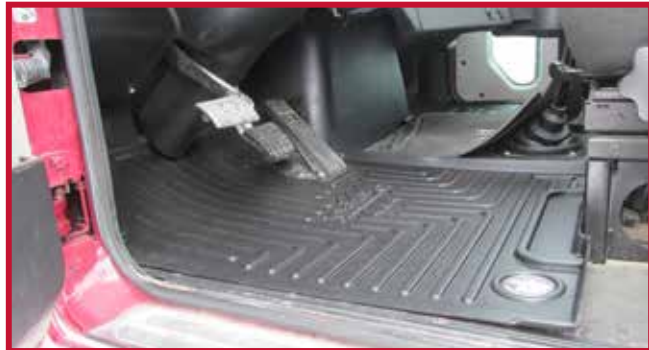
Figure 4 – Placement du tapis côté conducteur

• Le tapis côté conducteur doit être poussé à fond vers l'avant afin que la lèvres avant soit entièrement en contact avec le panneau de finition de la section de jonction et la cloison pare-feu.